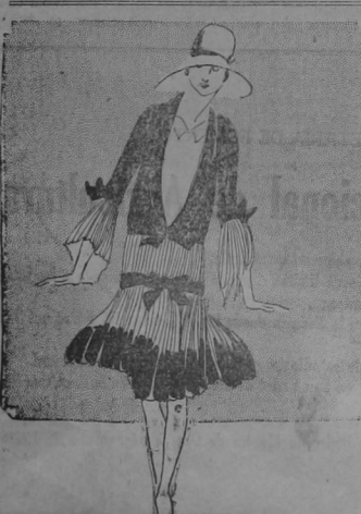
Las Placadas dan un Aire Delicado y Femenino a los Dorsos.

COMO CUIDAR EL CALZADO. Si se relajan los zapatos con papel de periódico cuando se están en uso, conservarán muy bien su forma. Para secar rápidamente los zapatos mojados refrenados de papeles de periódico y acérquese al fuego, teniendo cuidado de que no estén muy cerca y se vaya a quemar el cuero. Los zapatos que después de una jornada han quedado tiesos y duros suavizan dándoles una lavada ligera con agua tibia y después frotándolos con aceite castor. Si los zapatos nuevos aprietan más un trapo en agua muy caliente y exprímase poniéndolo después sobre el lugar donde queda apretado el zapato, y con este puesto para que el cuero tome la forma del pie. Tan pronto como el trapo se enfría se repite la operación. Para que los zapatos de charol no se partan frontones con vaselina y un trapo de franela y déjense así toda la noche; en seguida séquese los zapatos y quedarán como nuevos. Este remedio ha sido probado con excelentes resultados.