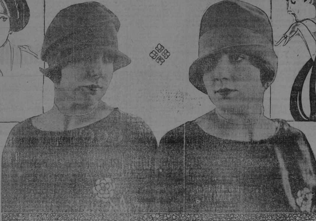
Uno de los modelos más nuevos es el de fieltro verde oscuro con la copa como el color escarlata. Precioso modelo, hecho de fieltro francés color leonado claro, y de líneas tan elegantes como reversa.

Entre los colores más nuevos hay un verde delicioso. Vi un sombrero con un cinta de fiala a los tonos, que duplia el color del fieltro y el otro mucho más obscuro. También pueden ribetearse con cinta del color del sombrero y adornarse con una banda color plata, como vienen